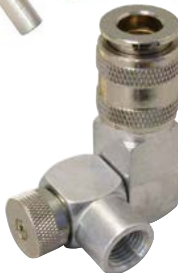
62.710 Raccord pivotant avec régulateur de débit et raccord rapide UNIVERSEL UNIMAX (accepte 5 types d'abouts)