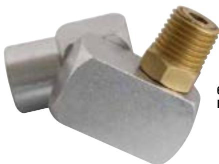
62.705 Raccord pivotant